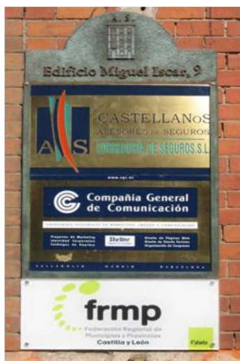
Gráfico nº 3: Placa informativa de oficinas en el número 9 de la calle

Había que empezar por lo más sencillo pero lo más útil para llevar a cado todo el plan de Comunicación. En unas horas nos habíamos identificado hacia el ciudadano que habita y circula por una de las zonas de negocio más destacadas de la ciudad de Valladolid. A falta de año y medio para el traslado a la nueva sede, había que situarse y destacarse en el número 9 de la calle Miguel Íscar.