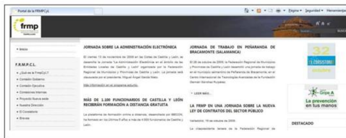
Gráfico nº 5: Imagen de la web de la federación

sión al verla es más bien de algo estático, poco atractiva, muy “burocrática”, y con demasiada información al mismo tiempo y desde la página de inicio. Por todo ello, y sin dudarlo ni un instante, decidí en el Plan de Comunicación encaminar la federación hacia un entorno 2.0 con el claro objetivo de mejorar la imagen de la FRMPCyL, al mismo tiempo que fidelizar a todos aquellos funcionarios que únicamente accedían a nuestra web para inscribirse en los cursos de formación.