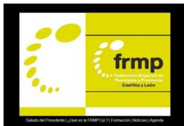
Gráfico nº 6: Imagen de la página de inicio de la futura web