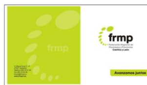
Gráfico nº 4: Díptico de frmp

En la página web se decía una cosa, en la agenda otra, el personal lo explicaba a su manera y para llegar a un público más generalista (salir del ámbito institucional para que el ciudadano de a pie conozca la Federación) había que estructurar el mensaje, comunicarlo de forma breve y, de esta forma, incrementar la confianza de los ciudadanos en la institución. Se diseñó un sencillo, pero práctico, díptico para conocer qué es la Federación, cuáles son sus objetivos y su estructura, dar a conocer nuestra página web y nuestra revista corporativa, y anunciar la construcción de nuestra futura sede. Habíamos dado un paso más, parecía que el cambio de logotipo empezaba a tener consecuencias y la comunicación interna estaba funcionando al transmitir ése cambio y hacer partícipes de ello al personal. La Federación empieza a comunicar.