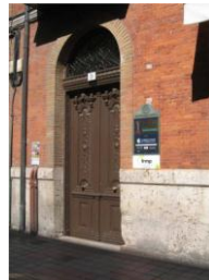
Gráfico n° 2: Número 9 de la calle Miguel Íscar de Valladolid

que pasen por la calle Miguel Íscar de Valladolid y logren encontrar el portal de la oficina. Fue lo que más me llamó la atención al llegar a mi nuevo destino. La placa identificativa del portal no estaba ni se la esperaba, había desaparecido hace tiempo y nadie se había ocupado de reponerla. Estaba claro: quedaba todo por comunicar.